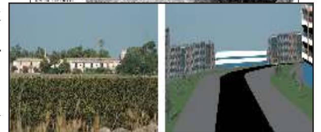
Según el proyecto Masía La Cova desaparecerá para ser carretera